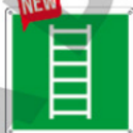
E15235 K ▲