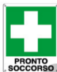
PRONTO SOCCORSO E20101 KXYZ