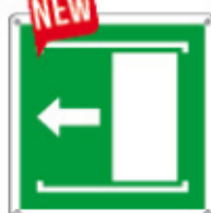
E15176 KW ▲