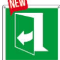
E15232 K ▲