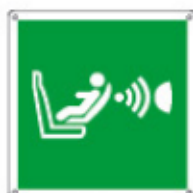
E15141 K ▲