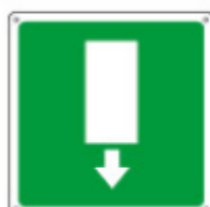
15152 KWXYZ *