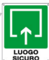
LUOGO SICURO 20194 WX