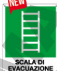
SCALA DI EVACUAZIONE E20199 X