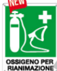
OSSIGENO PER RIANIMAZIONE E20198 X