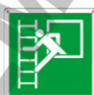
E15119 KWX ▲