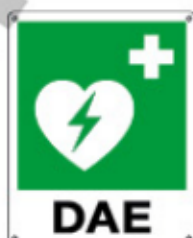
DAE E20109 KWX