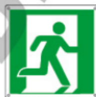
E15153 KWXYZL ▲