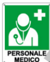
PERSONALE MEDICO E20196 KX