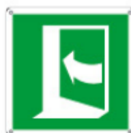
E15221 K ▲