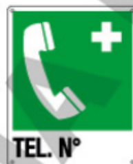
TEL. N° E20162 KWXYZ