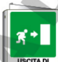
USCITA DI EMERGENZA