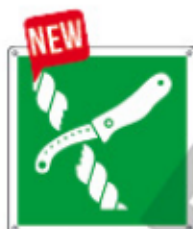
E15234 K ▲