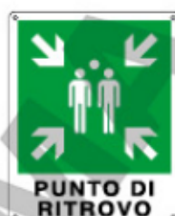
PUNTO DI RITROVO E20173 WXY