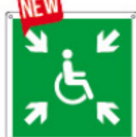
E15148 KW ▲