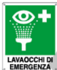
LAVAOCCHI DI EMERGENZA E20104 KWXYZ