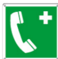
E15116 KWX ▲