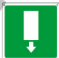
USCITA DI EMERGENZA