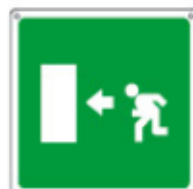
USCITA DI EMERGENZA