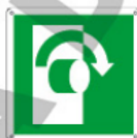
E15123 KWX ▲