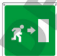
USCITA DI EMERGENZA