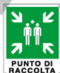
PUNTO DI RACCOLTA E20153 WXYZ