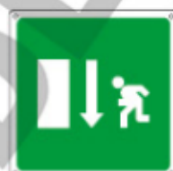
15150 WXYZ *