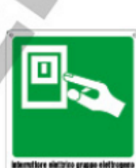
Manovrare elettrico gruppo elettrogeno MANOVRARE SOLO IN CASO D'INCENDIO 20166 X