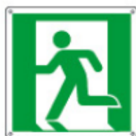
E15154 KWXYZL ▲