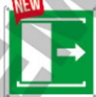
E15158 KW ▲