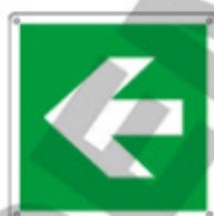
E15104 KWXYZ ▲