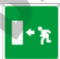
15154 KWXYZ *