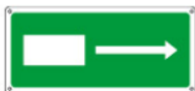
16026 WX *