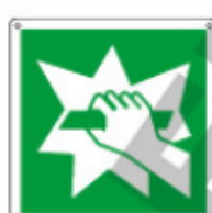
E15112 KWX ▲