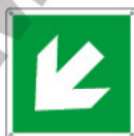
E15105 KWXYZ ▲