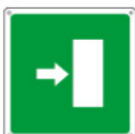
15155 WXYZ *