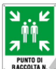
PUNTO DI RACCOLTA N. E20171 Y