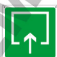
E15194 WX ■