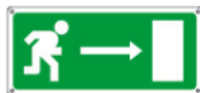
16024 WXY *