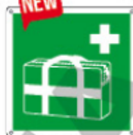
E15237 K ▲