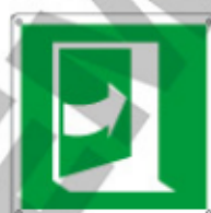
E15231 K ▲