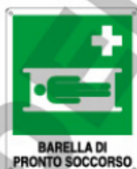
BARELLA DI PRONTO SOCCORSO E20154 KWXYZ