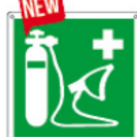
E15238 K ▲