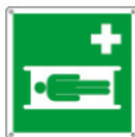
E15179 KWXY ▲