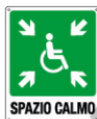
SPAZIO CALMO E20195 X