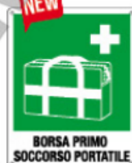
BORSA PRIMO SOCCORSO PORTATILE E20197 X