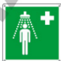
E15102 KWX ▲