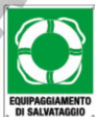
EQUIPAGGIAMENTO DI SALVATAGGIO 20500 X