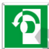
E15122 KWX ▲