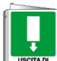
USCITA DI EMERGENZA