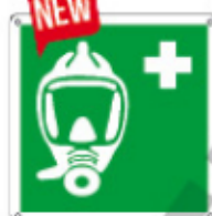
E15149 KW ▲