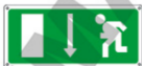
16027 WXY *