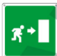
15153 KWXYZ *