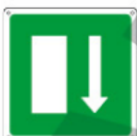
15178 KWXY *