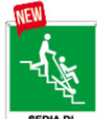
SEDIA DI EVACUAZIONE E20193 X