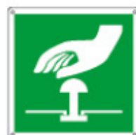
E15159 KWXYZL ▲