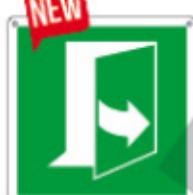
E15233 K ▲