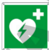
E15156 KWX ▲