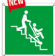
E15236 K ▲