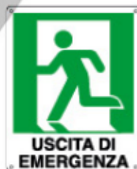
USCITA DI EMERGENZA E20105 KWXYZ