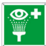
E15103 KWX ▲