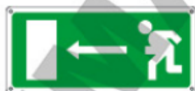
16025 WXY *