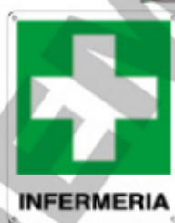
INFERMERIA E20102 KWXYZ