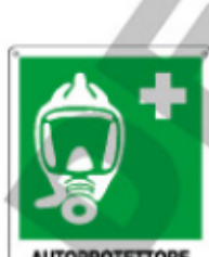
AUTOPROTETTORE AD ARIA COMPRESSA E20158 X