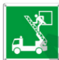
E15120 KWX ▲