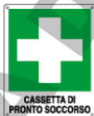
CASSETTA DI PRONTO SOCCORSO E20114 KWXYZ