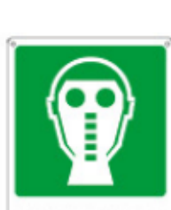
RESPIRATORI 20116 WX