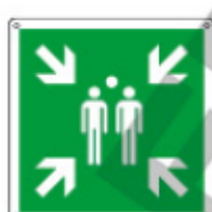
E15180 WXY ▲