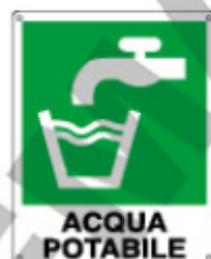
ACQUA POTABILE E20108 KXY