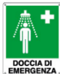
DOCCIA DI EMERGENZA E20103 KWXYZ