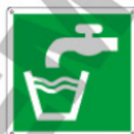
E15157 KXY ▲