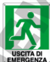
USCITA DI EMERGENZA E20106 KWXYZ