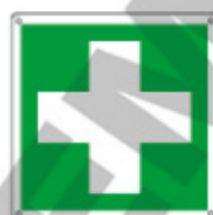
E15101 KWXY ▲