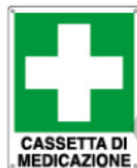
CASSETTA DI MEDICAZIONE E20113 KWXYZ