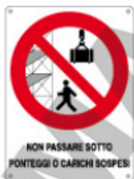
NON PASSARE SOTTO PONTEGGI O CARICHI SOSPESI