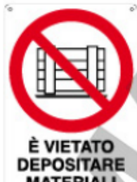
È VIETATO DEPOSITARE MATERIALI DAVANTI AGLI IDRANTI