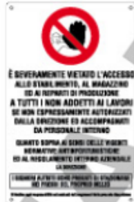
È SEVERAMENTE VIETATO L'ACCESSO ALLO STABILIMENTO, AL MAGAZZINO ED AI REPARTI DI PRODUZIONE A TUTTI I NON ADDETTI AI LAVORI SE NON ESPRESSAMENTE AUTORIZZATI DALLA DIREZIONE ED ACCOMPAGNATI DA PERSONALE INTERNO