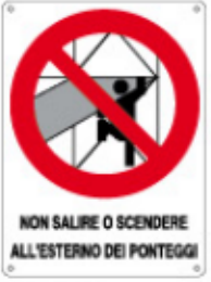
NON SALIRE O SCENDERE ALL'ESTERNO DEI PONTEGGI