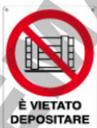
È VIETATO DEPOSITARE MATERIALI DAVANTI ALLE PORTE