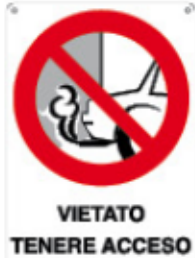
VIETATO TENERE ACCESO IL MOTORE