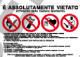
È ASSOLUTAMENTE VIETATO