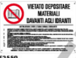
VIETATO DEPOSITARE MATERIALI DAVANTI AGLI IDRANTI