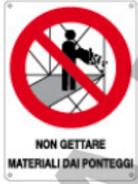
NON GETTARE MATERIALI DAI PONTEGGI