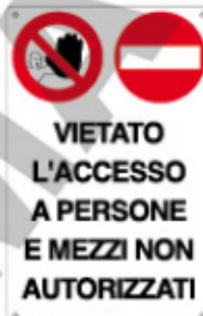
VIETATO L'ACCESSO A PERSONE E MEZZI NON AUTORIZZATI