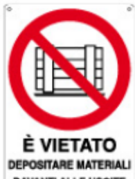
È VIETATO DEPOSITARE MATERIALI DAVANTI ALLE USCITE DI SICUREZZA