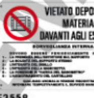
VIETATO DEPOSITARE MATERIALI DAVANTI AGLI ESTINTORI