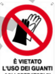
È VIETATO L'USO DEI GUANTI AGLI OPERATORI DI MACCHINE UTENSILI