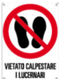
VIETATO CALPESTARE I LUCERNARI