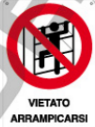
VIETATO ARRAMPICARSI SUGLI SCAFFALI