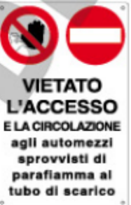
VIETATO L'ACCESSO E LA CIRCOLAZIONE agli autoveicoli sprovvisti di parafiamma al tubo di scarico