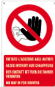
VIETATO L'ACCESSO AGLI AUTISTI ACCESS INTENDY AUX CHAUFFEURS DER ENTRITT MIT FUER DIE FRAGER VERBOTEN NO WAY IN FOR DRIVERS