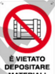
È VIETATO DEPOSITARE MATERIALI DAVANTI AGLI ESTINTORI