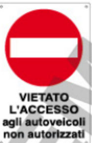
VIETATO L'ACCESSO agli autoveicoli non autorizzati

Tutti i cartelli sono disponibili in alluminio nei formati indicati in tabella. I codici con la sigla S sono forniti in pellicola autoadesiva.