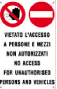
VIETATO L'ACCESSO A PERSONE E MEZZI NON AUTORIZZATI NO ACCESS FOR UNAUTHORISED PERSONS AND VEHICLES