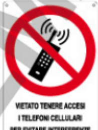
VIETATO TENERE ACCESI I TELEFONI CELLULARI PER EVITARE INTERFERENZE CON LE ATTREZZATURE MEDICHE