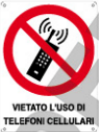
VIETATO L'USO DI TELEFONI CELLULARI