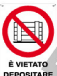
È VIETATO DEPOSITARE MATERIALI