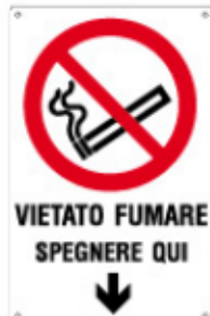
VIETATO FUMARE SPEGNERE QUI