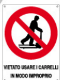
VIETATO USARE I CARRELLI IN MODO IMPROPRIO