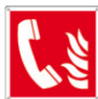
E15167 KWXY ▲