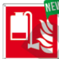
E15501 X ▲