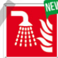
E15502 X ▲