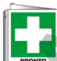
PRONTO SOCCORSO E20101BI WXY