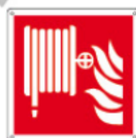
E15115 KWXYZ ▲