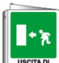
USCITA DI EMERGENZA 20105BI WXY