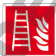
E15168 X ▲