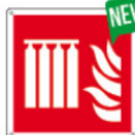
E15500 X ▲