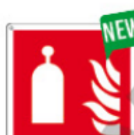
E15505 X ▲