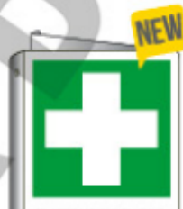
INFERMERIA E20102BI X