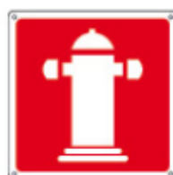
15129 WXYZ ■