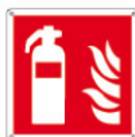
E15107 KWXYZ ▲