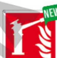
E15506 X ▲

IL SIMBOLO "IDRANTE" CONFORME ALLA UNI 7540-8, NON È CONTENUTO NEL DECRETO LEGISLATIVO 81/2008; È INVECE PRESENTE NELLA CIRCOLARE N. 4/2001 DEL MINISTERO DEL LAVORO E DELLA PREVIDENZA SOCIALE.