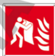
E15121 KW X ▲