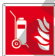
E15165 KWXYZ ▲