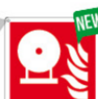
E15504 X ▲