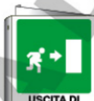
USCITA DI EMERGENZA 20106BI WXY