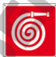
E15106 KWXYZ ■

SIMBOLI NON A NORMA UNI EN ISO 7010. I CARTELLI CON QUESTI SIMBOLI SONO FORNIBILI A RICHIESTA.