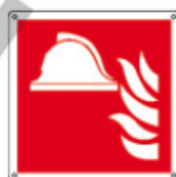
E15111 KX ▲