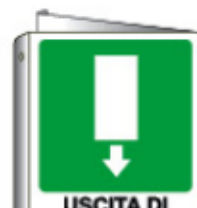
USCITA DI EMERGENZA 20107BI WXY