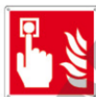
E15117 KWXY ▲