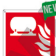
E15503 X ▲