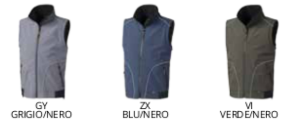
GY GRIGIO/NERO ZX BLU/NERO VI VERDE/NERO