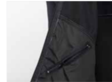
1 taschino interno al petto destro chiuso con cerniera