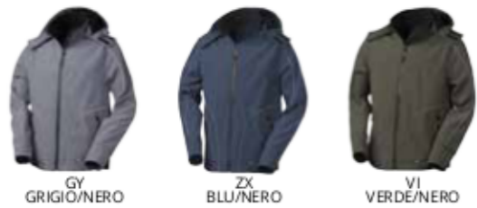
GY GRIGIO/NERO ZX BLU/NERO VI VERDE/NERO