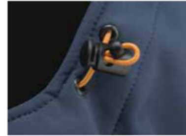
cappuccio con coulisse e velcro di chiusura applicato al giubbotto tramite cerniera