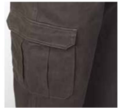
2 tasconi applicati con soffietto laterale e centrali chiusi con aletta e punto velcro