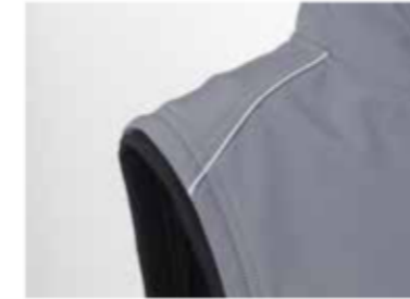
giromanica con inserto in maglia elastica