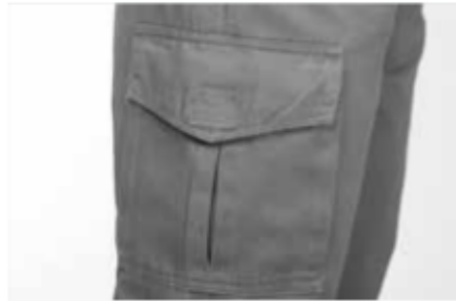
2 tasconi applicati con soffietto laterale e centrale chiusi con aletta e punto velcro