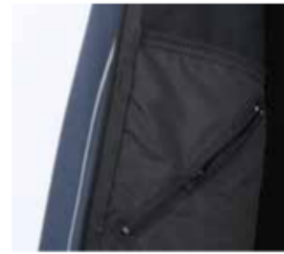
1 taschino interno al petto destro chiuso con cerniera