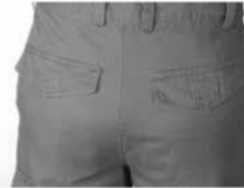
2 tasche posteriori interne a filetto chiuse con aletta e punto velcro