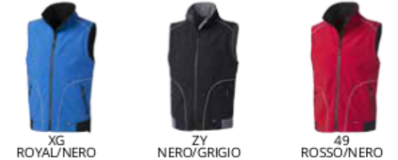
XG ROYAL/NERO ZY NERO/GRIGIO 49 ROSSO/NERO