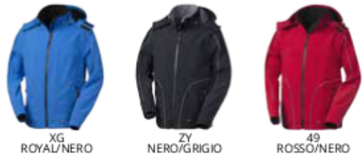
XG ROYAL/NERO ZY NERO/GRIGIO 49 ROSSO/NERO