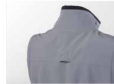
foro di aerazione su schiena