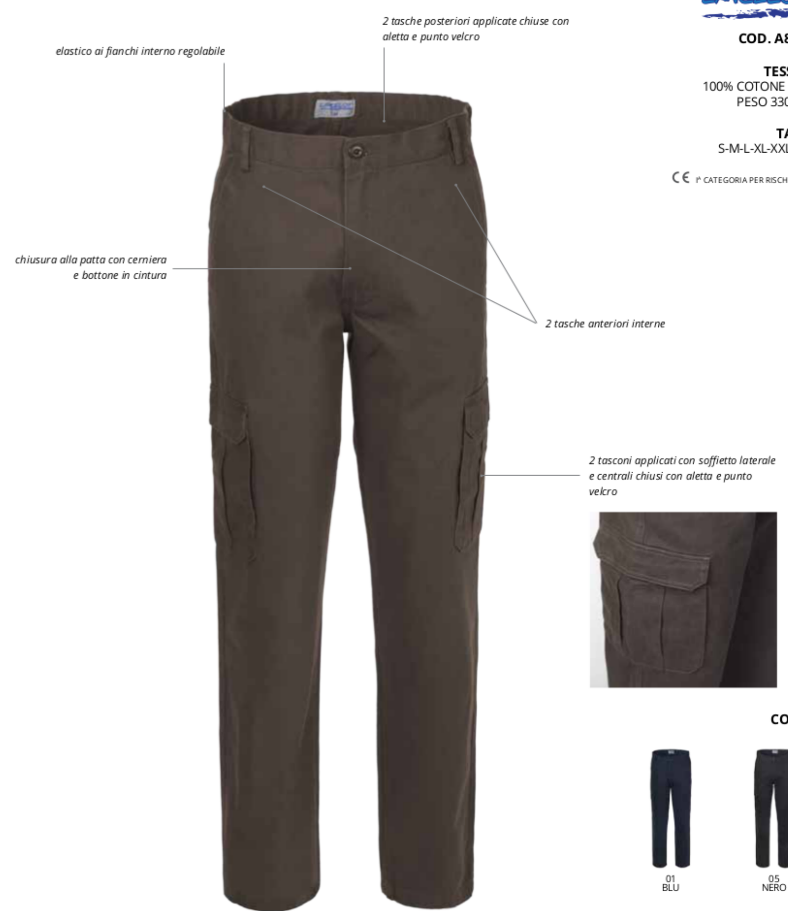
elastico ai fianchi interno regolabile